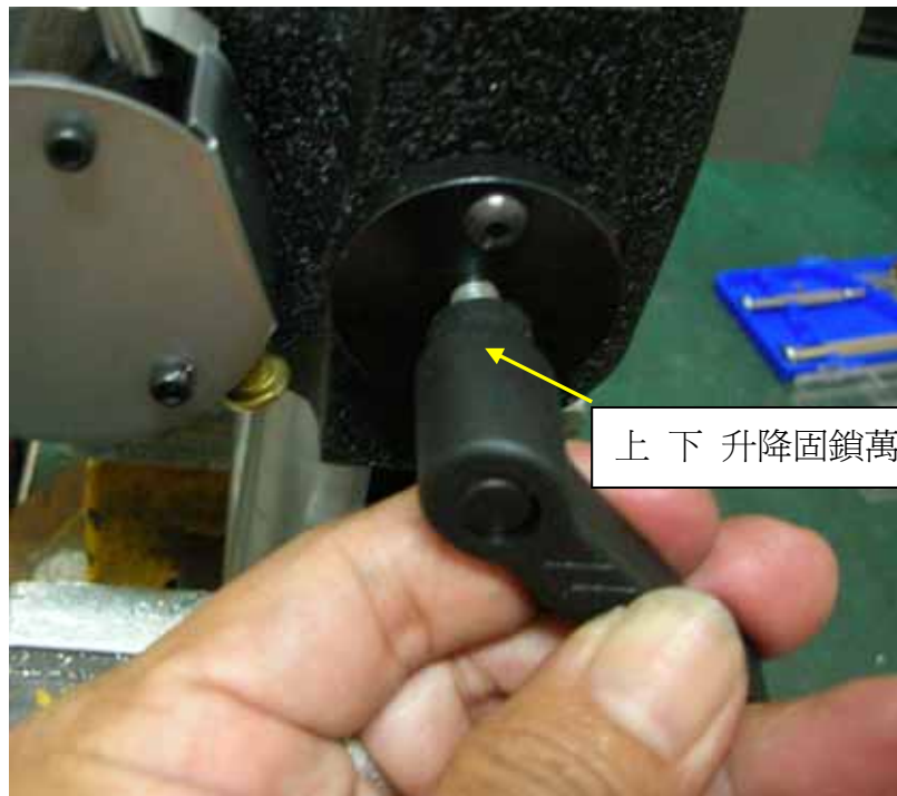
上下升降固鎖萬向L板扭